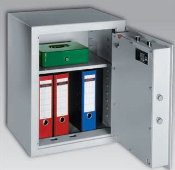
img.: NM 10-05

Wertschutzschranke zur Aufbewahrung vor Einbruch für Bargeld, Schmuck und Unterlagen. Geprüfte Sicherheit nach EN 1143-1 Grad 0. Gut auch als Möbeleinsatztresor nutzbar.