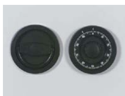
Art. Nr.: 36020