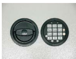
Art. Nr.: 36021+ Art. Nr.: 36022