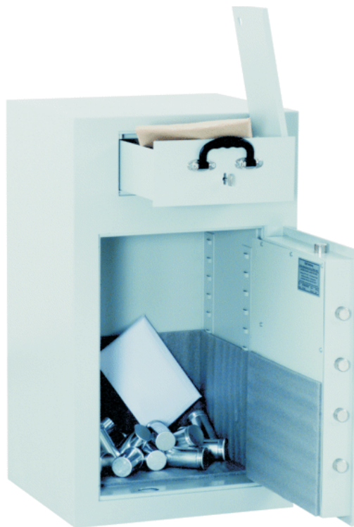
Alle Abb. Art.-Nr. 36001 mit DB-Standardschloss