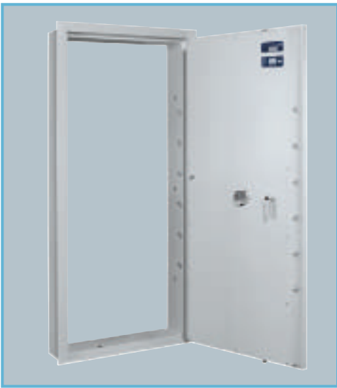
Abb.: AT 2, mit Sonderausstattung EZ, LG Basic, Notöffnung von innen elektrisch