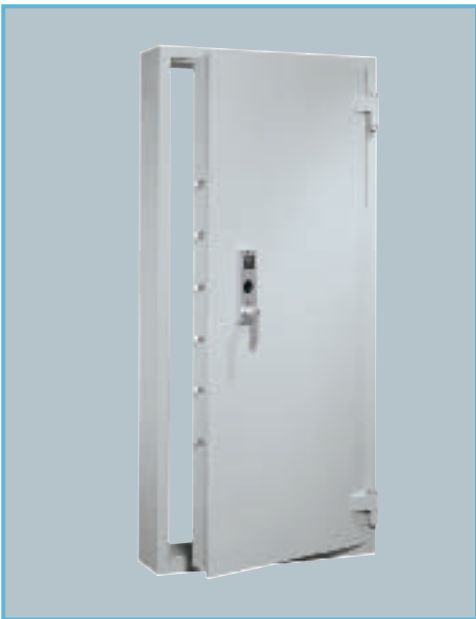
Abb.: AVB 20, Blockzarge (mit Sonderausstattung EZ, Code Combi B)