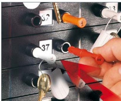
BedienerStick einführen ...