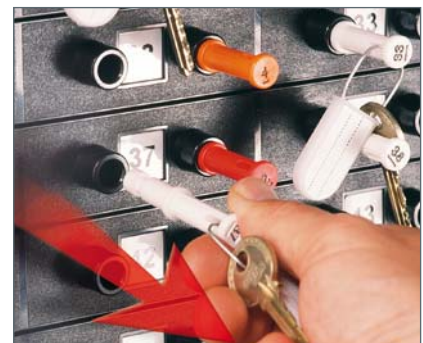
... Schlüsselstick entnehmen!

Zur Entnahme eines deponierten Schlüssels muss der personalisierte BedienerStick das dem Schlüsselstick zugehörige Schloss entsperren. Der BedienerStick kann erst nach Entriegelung durch Rückgabe des Schlüsselbundes in das korrespondierende Schloss wieder entnommen werden. Durch seine Farbe und/oder seine Kennzeichnung gibt er die Identität seines Anwenders laut einer individuellen Zuordnungsliste preis.