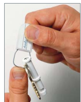
SchlüsselPlombe (TN 565005W)

Ein neu zu deponierender Schlüssel wird zusammen mit dem nummerierten SchlüsselStick in einer SchlüsselPlombe zusammengefasst und dauerhaft versiegelt. Nach Bedarf kann der Bund auf den dafür vorgesehenen Feldern zusätzlich gekennzeichnet werden.