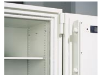
3-wandig (Tür und Tresorkorpus)