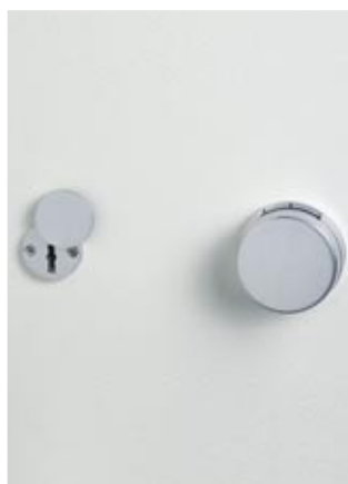
Verschlussvariante 1 DSS mit Schlüsselrosette (Standard)