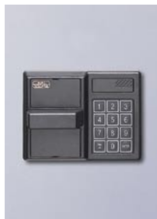
Verschlussvariante 3 ELO SECU E 4000 / DSS Alternativ: 2 x SECU E 4000