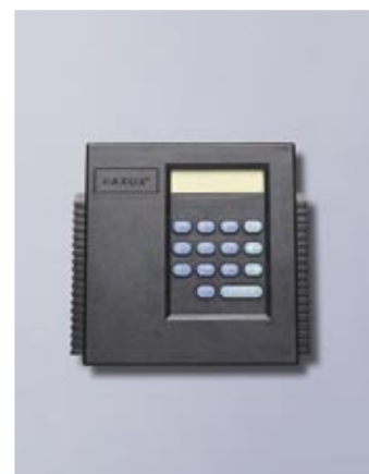
Verschlussvariante 4 * ELO Paxos Compact mit 2 Verschlusssystemen in einer Tastatur