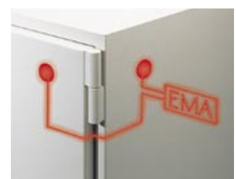
Verdoppelung des Versicherungsschutzes